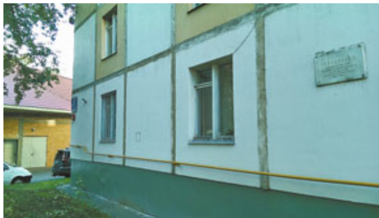
Памятная доска на доме 31, корпус 2 гласит, что улица Гарибальди названа в честь национального героя Италии.