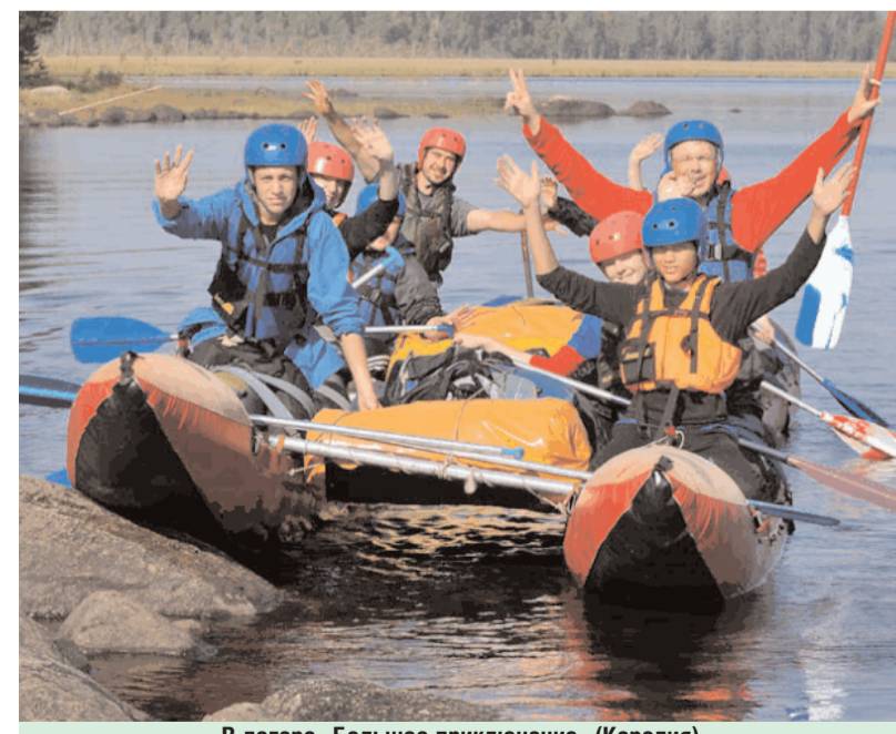
В лагере «Большое приключение» (Карелия)

В летний период 2012 года в детских оздоровительных лагерях отдохнули 43 ребенка, состоящие на учете в отделе опеки, попечительства и патронажа и в